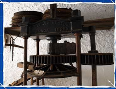
ECOMUSEO LAGAR DE TORRIJOS. MÁLAGA